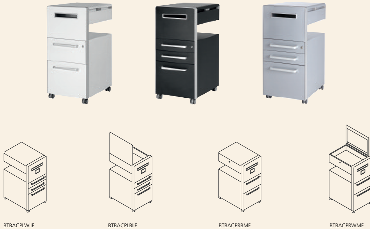
BTBACPLWIF BTBACPLBIF BTBACPRBMF BTBACPRWMF